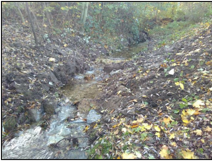
Abb. 3: Nach der Maßnahme: Verbesserung der Durchgängigkeit der Sohlrampe (Querbauwerk AKZ 13344) durch Sohlriegel und Steinschüttung, 13.11.2020