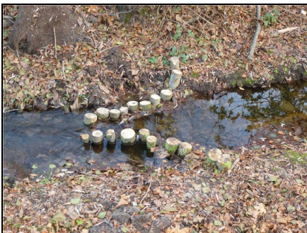
Abb. 5: Nach der Maßnahme: Strömungstrichter zur Initiierung von Strömungsdiversität, 16.12.2020