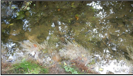
Abb. 2: Vor der Maßnahme: hoher Feinsedimentanteil im Gewässerbett, 28.09.2017