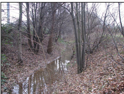
Abb. 1: Vor der Maßnahme: Gewässerabschnitt mit geringer Strömungs- und Tiefenvarianz, 12.12.2014