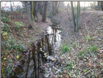
Abb. 4: Nach der Maßnahme: Initiierung von Strömungs- und Tiefenvarianz durch Buhnen, 16.12.2020