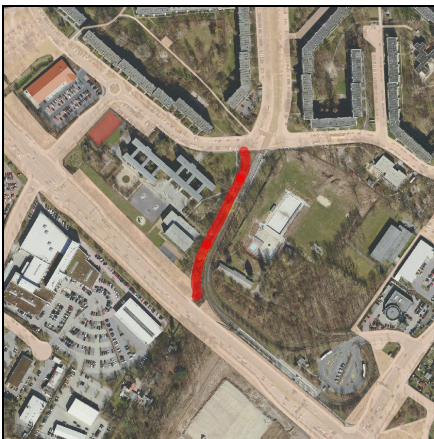
Lageplan Maßnahme, Maßstab 1:10.000